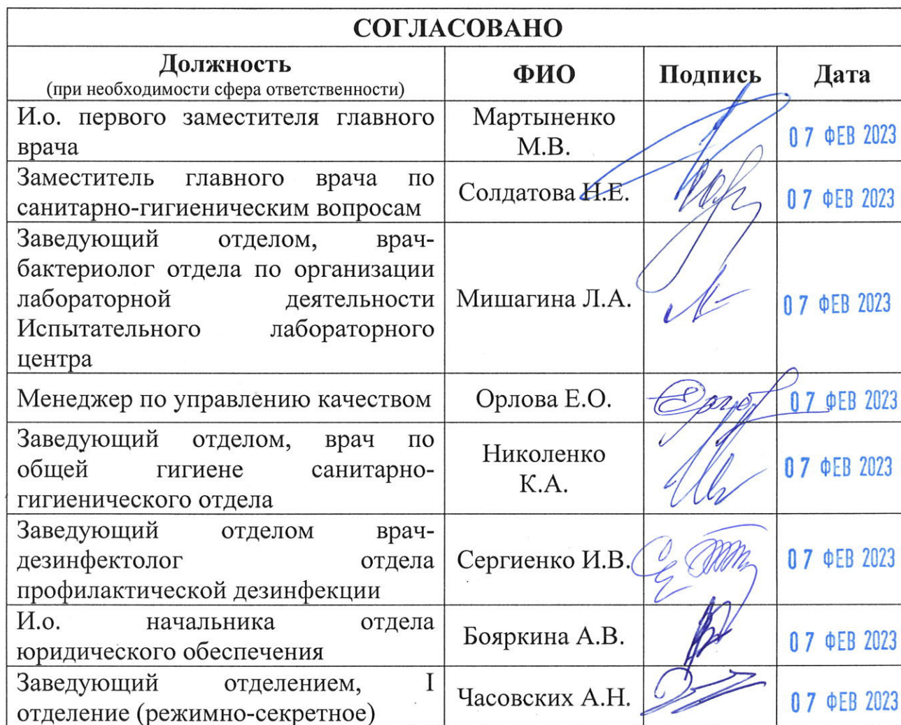
Таблица согласования документа